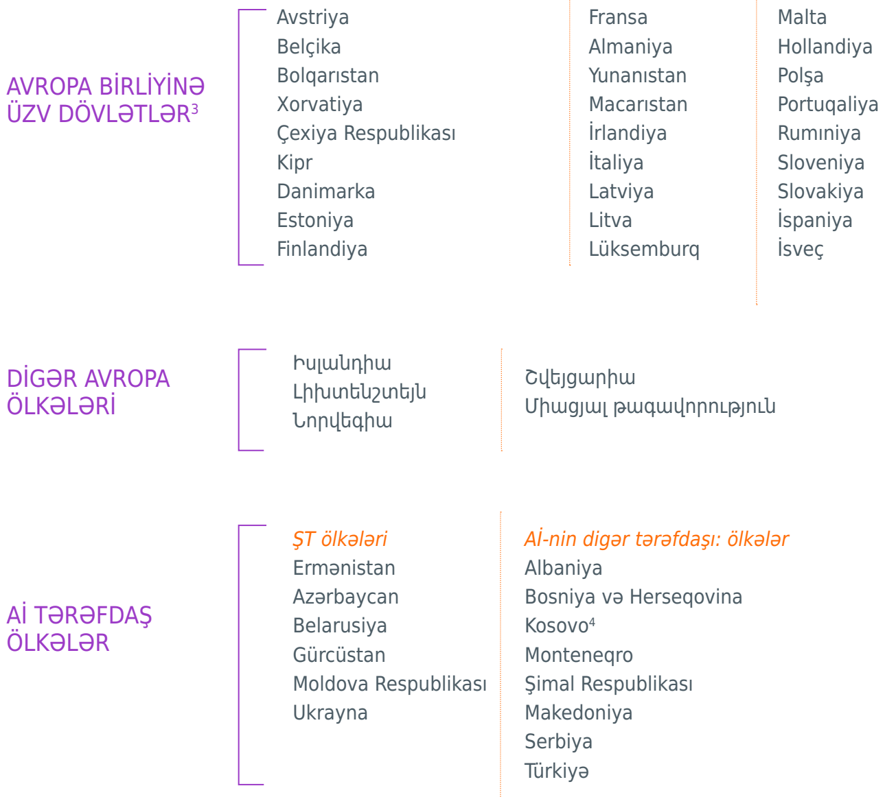
Diaqram 1 Gürcüstanda Şərq Tərəfdaşlığı Avropa Məktəbi Layihəsinin Uyğun Sahəsi

BELARUSIYA ÜÇÜN: Hal-hazırda Belarusda yerləşən və ya 2020-ci ilin avqustundan etibarən Cədvəl 1-də göstərilən ölkələrdən birinə köçürülmüş Belarusun qanuni daimi sakini olun.