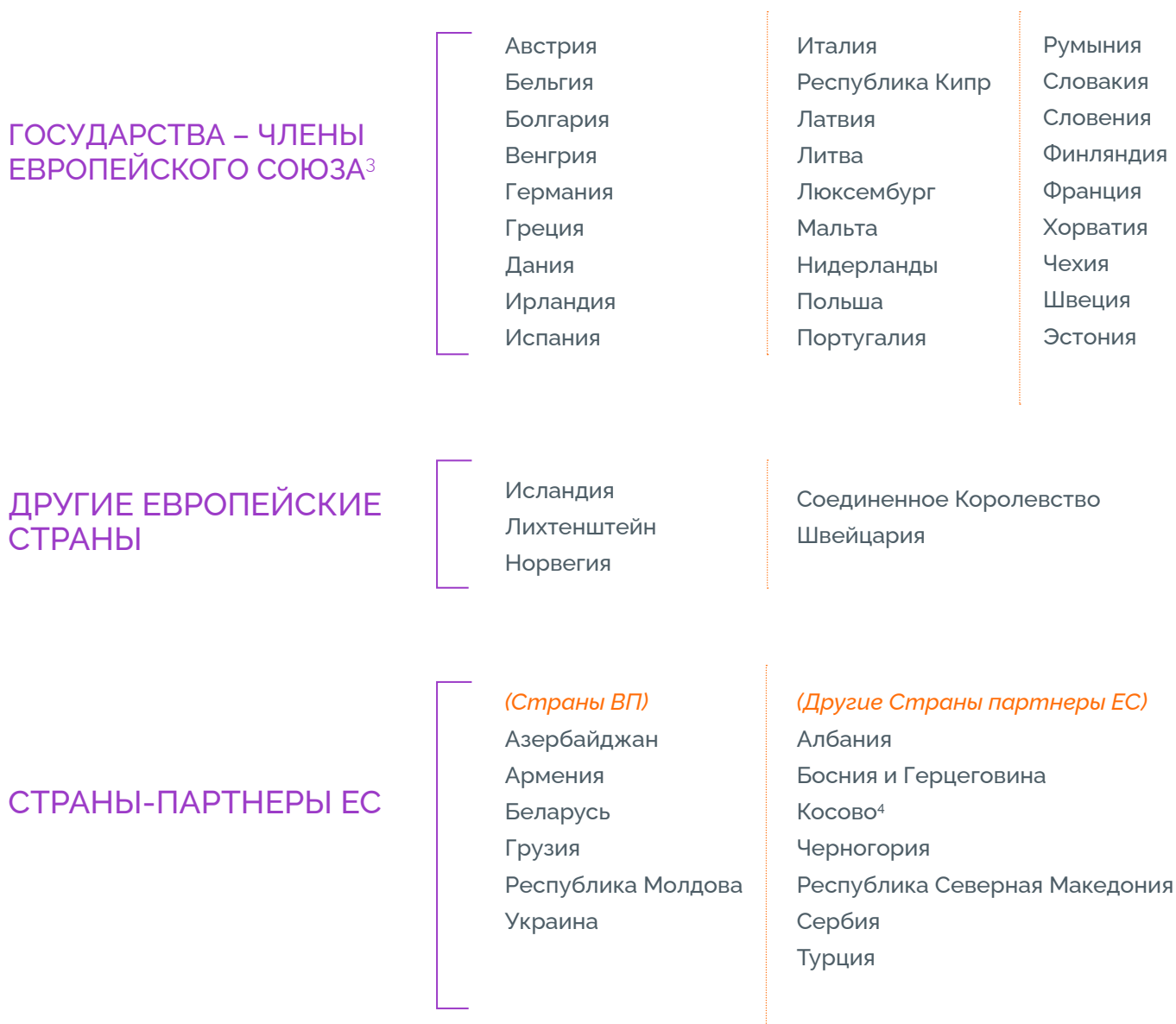
Диаграмма 1. Приемлемая территория проекта Европейской школы Восточного партнерства в Грузии

ДЛЯ БЕЛАРУСИ: в настоящее время быть законным постоянным жителем Беларуси, находиться в Беларуси или переехать в одну из стран, указанных в таблице 1, начиная с августа 2020 года.